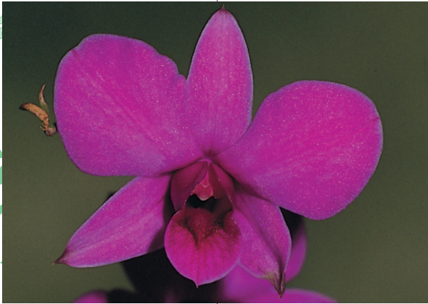
Dendrobium Louis Bleriot