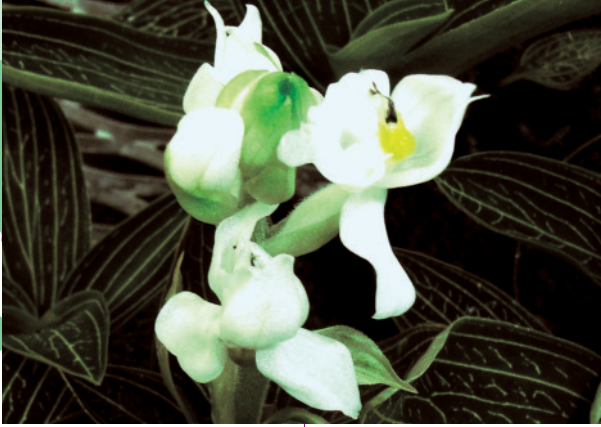
Ludisia discolor ‚alba‘