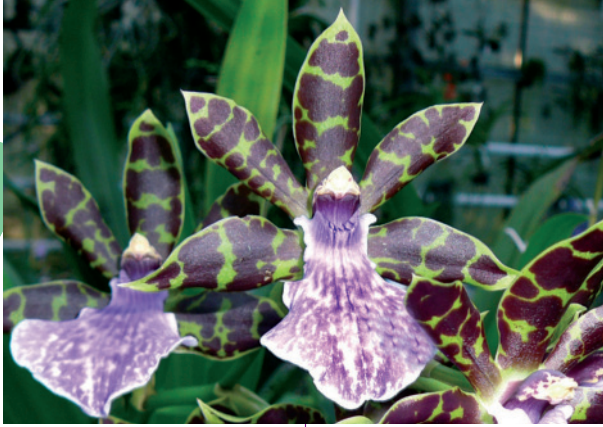
Zygotetulum Bärbel Höhn